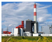
Kraftwerk Theiss (AT)