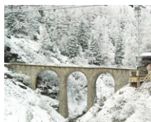
Val da Pila (CH)