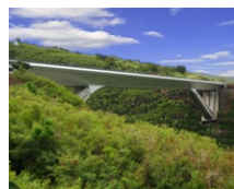
La Réunion (FR)