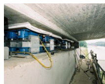
Maas Waalkanaal (NL)